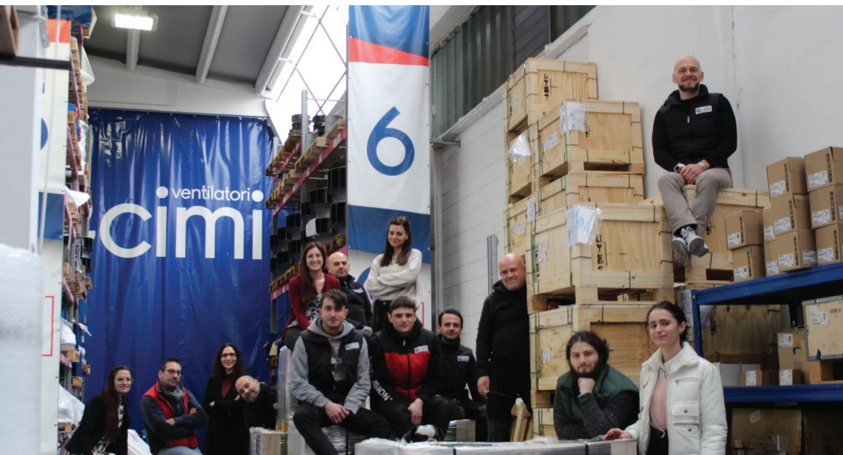
LA REALTÀ DI LEINÌ È FORMATA DA UN TEAM GIOVANE E APPASSIONATO