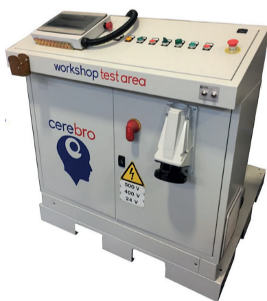
BANCHI PROVA DI FINE LINEA CON REPORT AUTOMATICI E CERTIFICATI