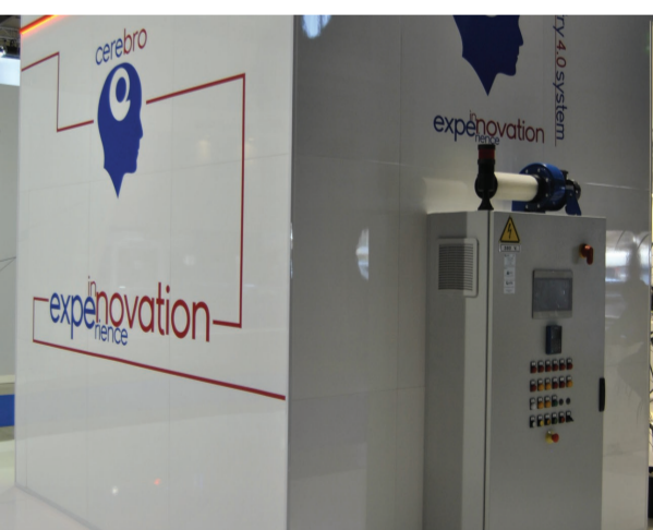
CEREBRO SOPPERISCE A TUTTE LE PROBLEMATICHE INDUSTRIALI

Tutto ciò con la sicurezza che rappresenta una priorità assoluta per le aziende: fornire agli operatori i corretti strumenti per mantenere alti standard in materia è per CIMI un dovere quotidiano.